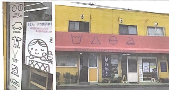
▲入り口でメニュー紹介