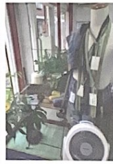
▲活性化する E.M. 洗剤

洗剤の汚れ落としに用いる洗剤は、化学物質の使用を大幅に減らすこと、合成洗剤の使いをやめ、天然素材による洗剤(通称 E.M. Effactive Microfibrils (E-クリーン))を始めたこと。