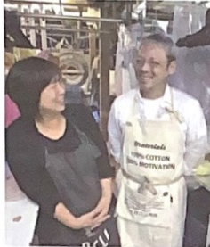
▲「とにかくやってみる」が大切と語る

「ファン作り」は、HPの作成・運用から販売メールの作成・配信まで全て丸投げOKという点が魅力。以下で東京都府中市の「クリーニング」(以下、同店)の事例を紹介する。